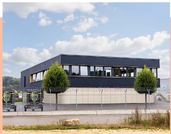
Außerhalb. In einem Industriegebiet in Heidenheim an der Brenz – weitab strategischer Angriffsziele – steht die Schließfachanlage von EMS Werteinlagerung.