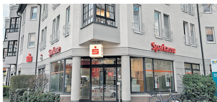
Die Filiale der Mittelbrandenburgischen Sparkasse in Blankenfelde-Mahlow.